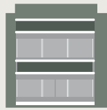
Ιδιωτική Εκπαίδευση - Κοινωνική Μέρημα